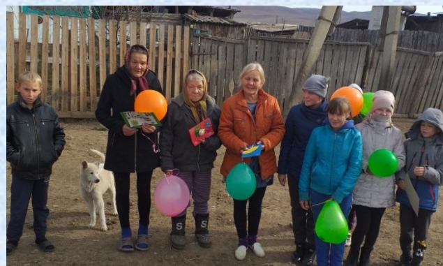
Акция «Из детских рук частичку доброты»