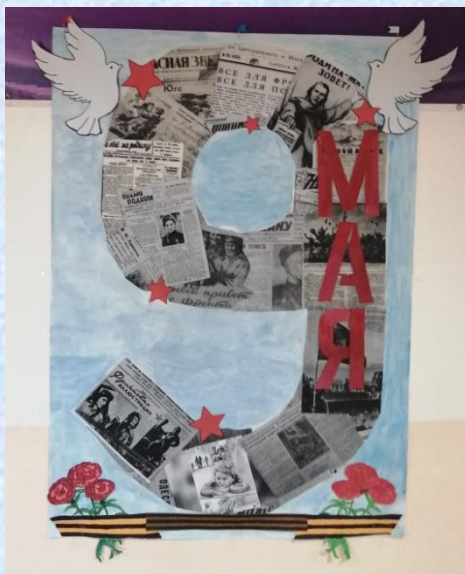
Праздничный выпуск газеты