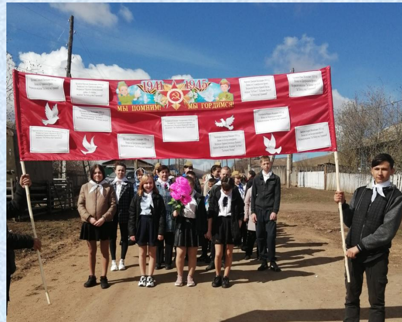
На митинг 9 мая. Полотно Победы.