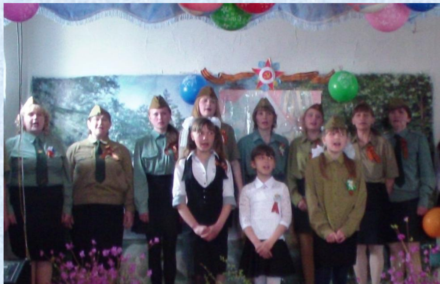
Участие в праздничном концерте для жителей села