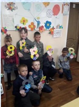
Открытка для мамы.