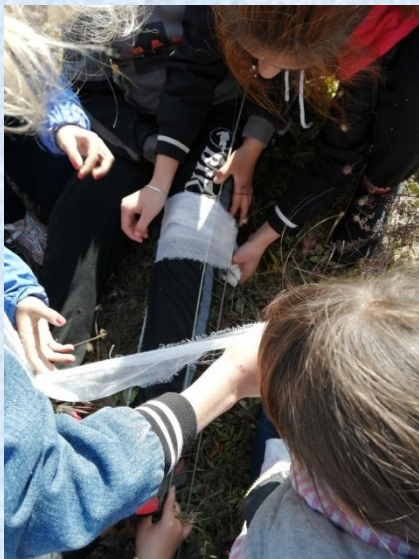
Учимся оказывать первую помощь