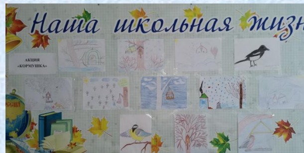
Организация выставок «Наша школьная жизнь»