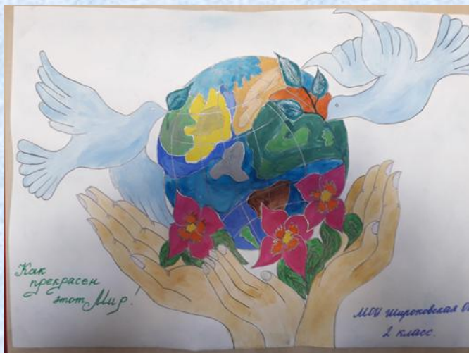
Конкурс баннеров «Как прекрасен этот мир!»