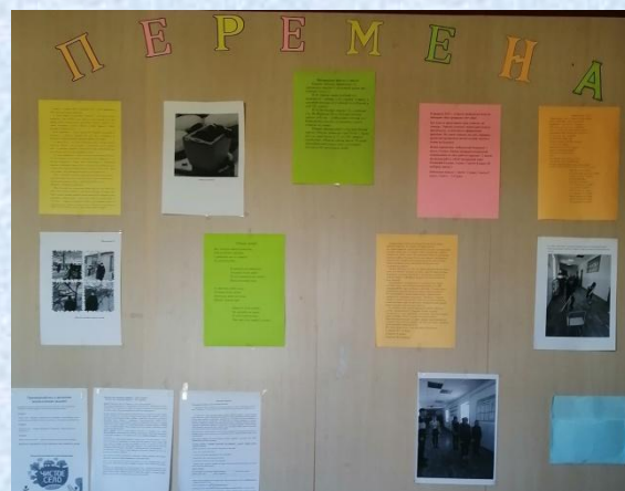
Выпуск школьной газеты «Перемена»