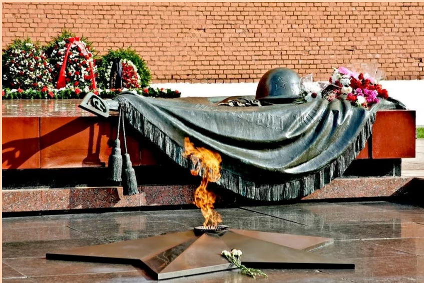
Могила Неизвестного солдата. Вечный огонь.

«КАКОВО ТВОЁ ДЕЯНИЕ, ТАКОВО И ВОЗДАЯНИЕ»