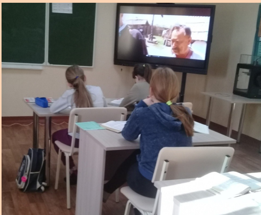
Просмотр видеосюжета фильма «Тарас Бульба»